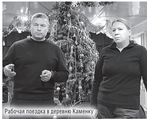
Рабочая поездка в деревню Каменку

В 2025 году было отремонтировано 2536 метров проездов и 4911,4 метра тротуаров. Из районного бюджета на эти цели выделено 84,6 миллиона рублей. Ремонт проездов и тротуаров был выполнен в Малоземельском, Великовисочном, Омском и Канинском сельсоветах. Кроме