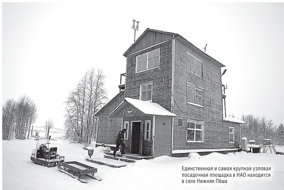
Единственная и самая крупная узловая посадочная площадка в НАО находится в селе Нижняя Пёша

– Нарьян-Марский объединённый авиаотряд обеспечивает жизнедеятельность своих объектов в соответствии с нормативно-правовой базой и гарантирует годность посадочных площадок для выполнения полётов. Исторически сложилось