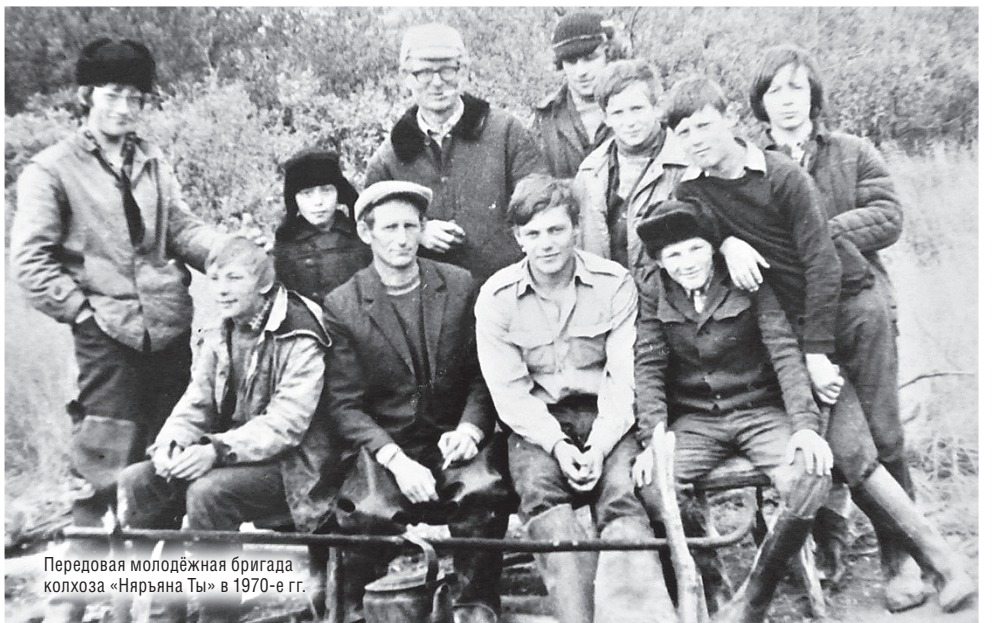
Передовая молодёжная бригада колхоза «Нарьяна Ты» в 1970-е гг.