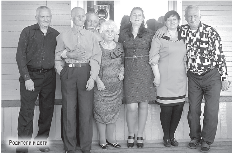
Родители и дети