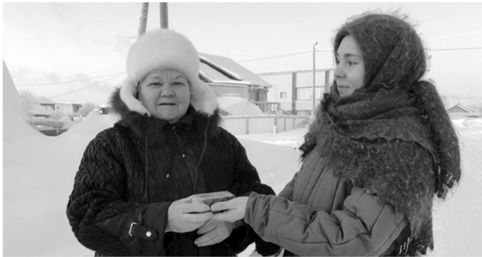
В посёлке Красное активисты раздали 24 хлебных пайка

Гимнастёрки, фуфайки, платки, пуховые шали и валенки – волонтеров, одетых в соответствии с эпохой, о которой они рассказывали прохожим, можно было встретить во многих муниципальных образованиях Заполярного района НАО. Акция, посвященная Дню воинской славы России, – Дню полного освобождения Ленинграда от фашистской блокады состоялась – 27 января. В этот день во всех образовательных учреждениях региона прошли уроки памяти.