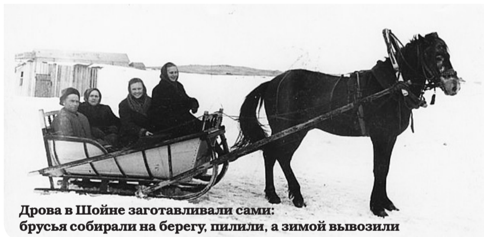
Дрова в Шойне заготавливали сами: брусья собирали на берегу, пилили, а зимой вывозили

В 17 лет его забрали на войну, три года воевал: неделю на передовой, столько же давали на отдых – так и прошёл от Волги