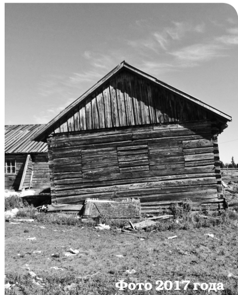
Фото 2017 года

В Верхней Пеше проведён капитальный ремонт телятника на сто голов.