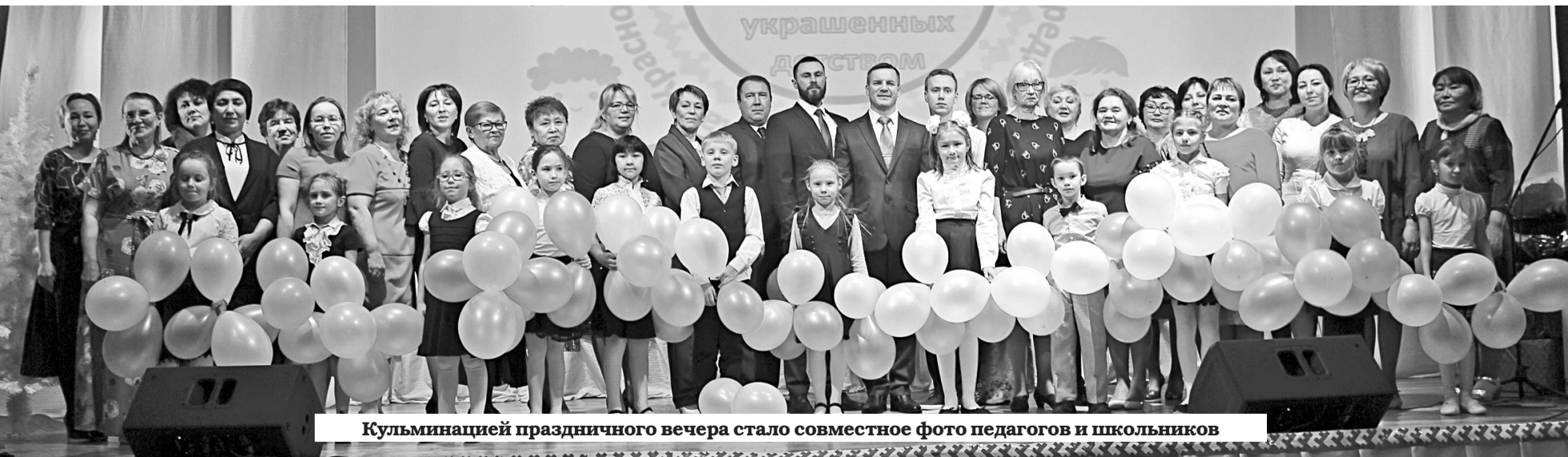
Кульминацией праздничного вечера стало совместное фото педагогов и школьников

Празднование юбилея красновской школы завершилось встречей ветеранов учебного заведения, выпускников разных лет и концертом с участием местных артистов и вокалистов из Нарьян-Мара и Тельвиски. Положительные эмоции и самые добрые воспоминания останутся надолго в душе каждого, кто смог присутствовать на общем празднике «75, украшенных детством».