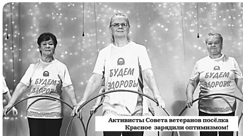
Активисты Совета ветеранов посёлка Красное зарядили оптимизмом!

Впервые на сцене зрители увидели поздравительные номера от Дома ремёсел «Тэмбойко», а также общества инвалидов. Завершилось мероприятие дружным исполнением гимна посёлка.