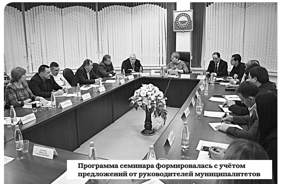
Программа семинара формировалась с учётом предложений от руководителей муниципалитетов

Также главы сельсоветов разобрали нюансы ведения документооборота, подготовки к отопительному сезону с руководством Заполярного района, обсудили вопросы благоустройства территорий, содержания и строительства муниципального жилья.