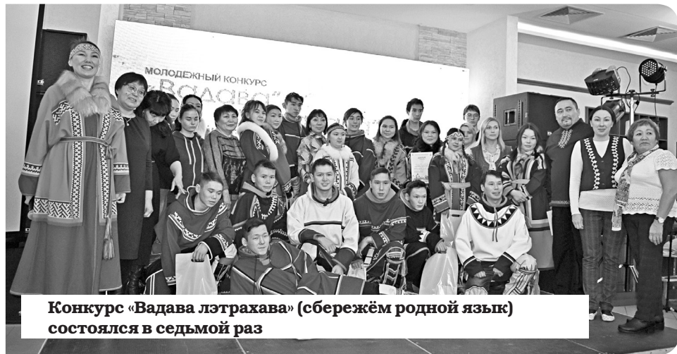
Конкурс «Вадава лэтрахава» (сбережём родной язык) состоялся в седьмой раз

«Вадава лэтрахава»! (сбережём родной язык) – конкурс с таким названием состоялся в Этнокультурном центре НАО. Мероприятие прошло в рамках Дней ненецкой письменности и объединило молодёжь из Малоземельской, Большеземельской и Канино-Тиманской тундр.