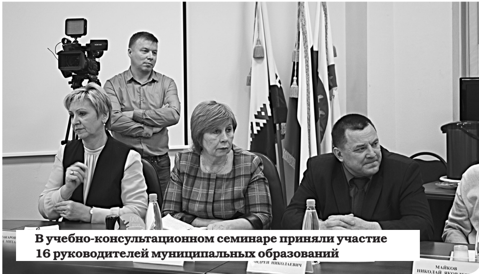
В учебно-консультационном семинаре приняли участие 16 руководителей муниципальных образований