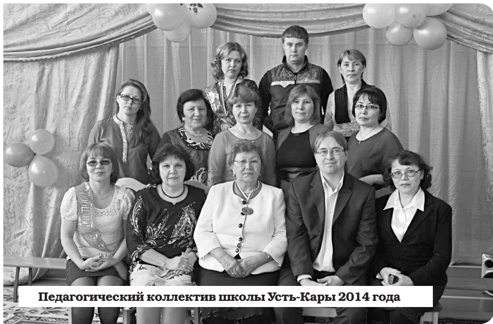
Педагогический коллектив школы Усть-Кара 2014 года

В Усть-Каре намечается торжественное событие – празднование юбилея школы. Её история насчитывает 85 лет. За эти годы школа переживала разные моменты, но, несмотря на трудности, всегда выполняла свой долг – давала знания жителям Карского побережья.