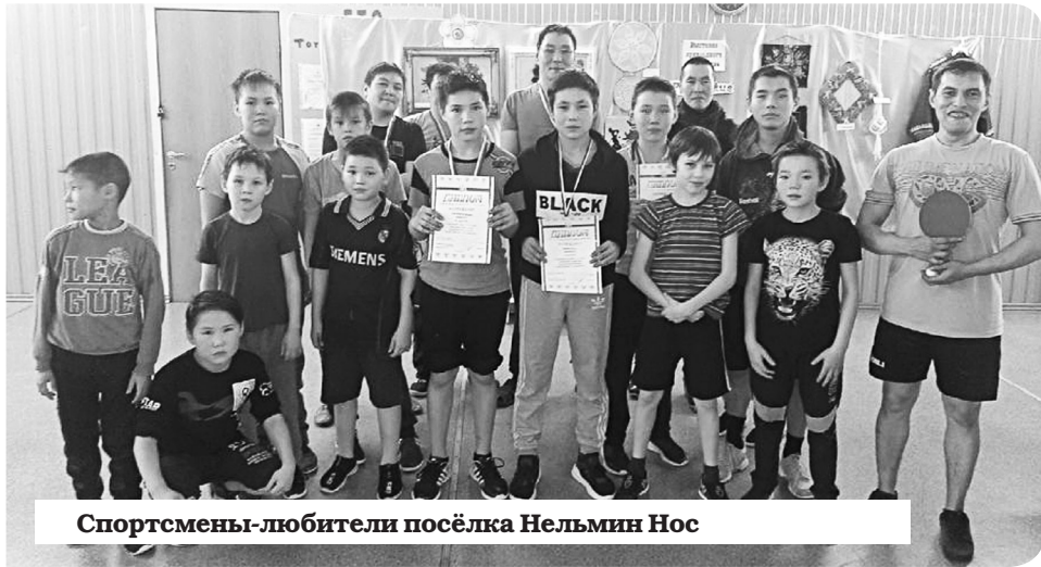
Спортсмены-любители посёлка Нельмин Нос

Месяц малой темноты в национальном посёлке Нельмин Нос коротают с пользой для здоровья. Не успели в муниципальном образовании подвести итоги спартакиады, как тут же организовали Первенство по настольному теннису. Соревнования состоялись 23 ноября, участие в них приняли 12 разновозрастных спортсменов.