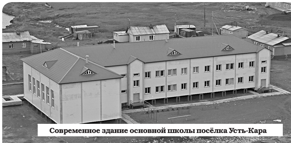
Современное здание основной школы посёлка Усть-Кара

Сейчас в списке образовательного учреждения 81 ученик, 20 ребят живут в интернате. В педагогическом составе 13 учителей, половина из которых выпускники Усть-Карской школы.