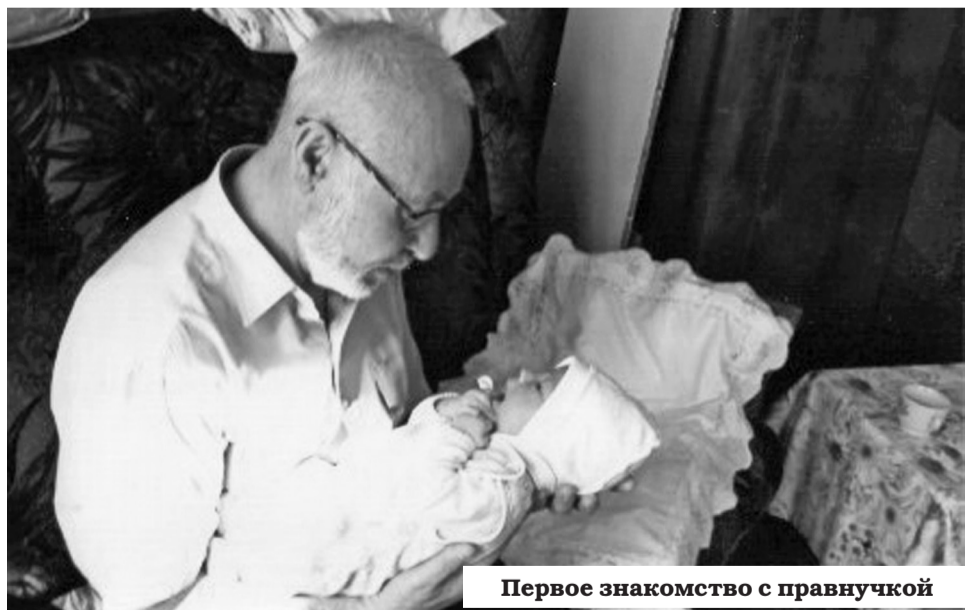
Первое знакомство с правнучкой

ми администрации Ненецкого автономного округа и предприятия, дважды (1981 г. и 2003 г.) знаком «Отличник разведки недр».