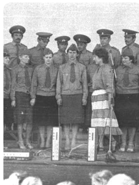
Хор военного госпиталя. Кабул, 1984 год

– Редко кто об этом спрашивает... У нас воинская часть была уникальной – советский госпиталь, так что девчонок было, как ни в какой другой части. Вот мы на фото в Кабуле, 1984 год. Здесь все медсёстры, меня тут по росту можно узнать, стою в центре, запеваля. Благодаря этому хору побывала во многих войсковых