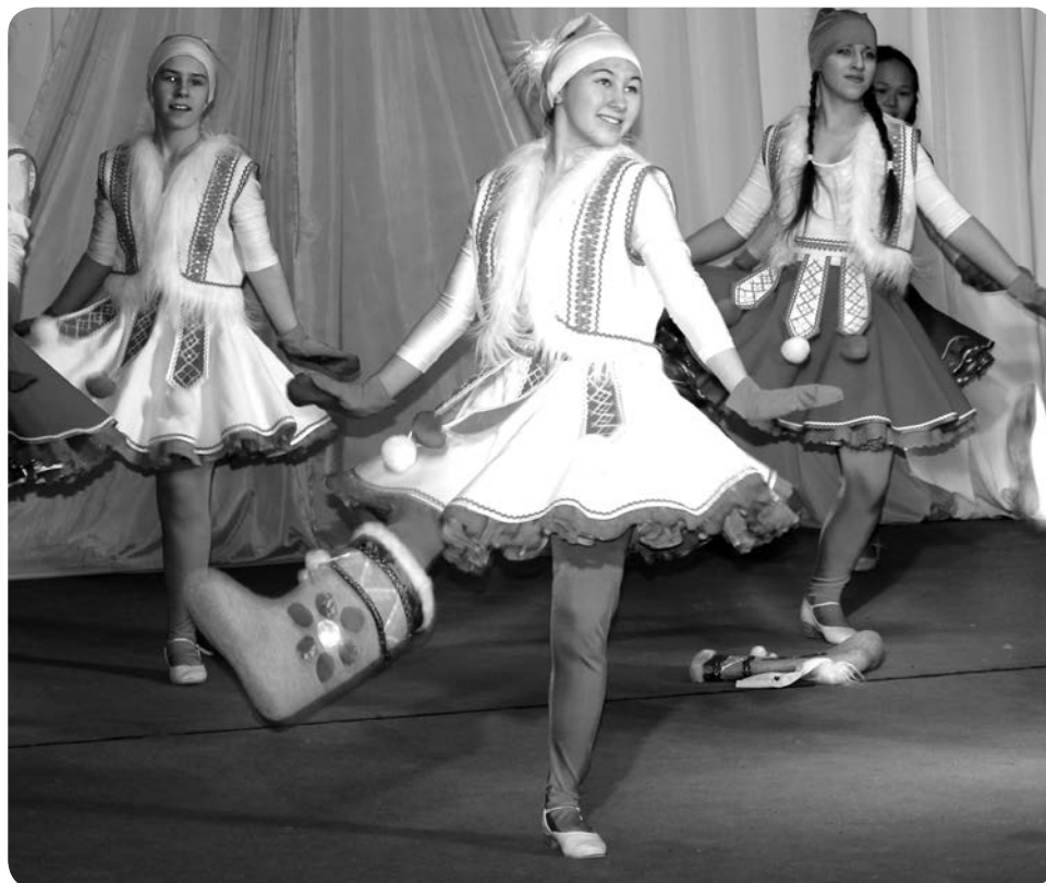
Выступает танцевальный коллектив из Красного

сценические костюмы появятся у детских и взрослых художественных коллективов из Омы, Макарово, Волоковой, Тельвиски, Оксина и Красного. Музыкальные инструменты поступят в Великовисочное, Оксина, Андег, Тельвиску, Индигу и Коткино. Новые технические возможности для подготовки мероприятий появятся у работников домов культуры в Шойне, Великовисочном, Оме, Каратайке, Оксина, Тельвиске, Макарово, Красном и Андеге. В эти муниципальные образования запланировано перечисление средств на приобретение световой и звуковой аппаратуры.