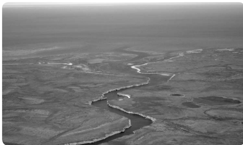
Заполярный район сейчас обозначат на географических картах