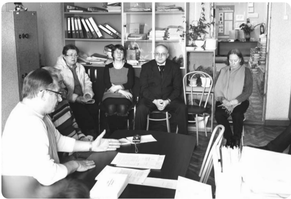
Встреча в администрации Хорей-Верского сельсовета

четверть. Персонал хорей-верской больницы ожидает окончания строительства нового больничного корпуса. Коллектив детского сада в Хорей-Вере прорабатывает вопрос с размещением групп на период строительства нового здания. Объект начнут возводить в начале 2015 года на месте старой постройки. В Харуте, где уже строится детский сад блочно-модульного типа,