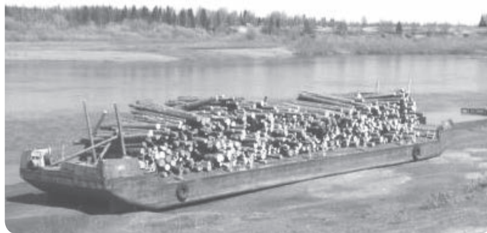
В Харуту завезли ценный груз

На территории сельсовета находится термальное урочище Пым-Ва-Шор (в переводе с коми – «Ручей горячей воды»), которое утверждено в статус особо охраняемой природной территории. Общая площадь природного памятника – около двух с половиной тысяч гектаров. Сюда входит комплекс из восьми