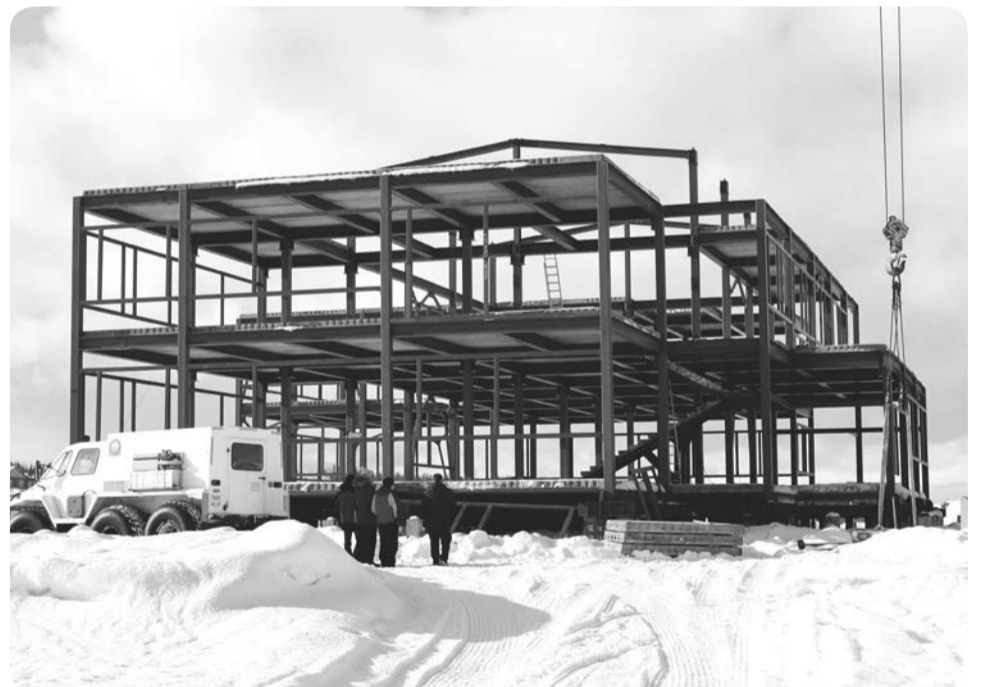
В Харуте строится детский сад блочно-модульного типа

В Хорей-Вере руководство района также осмотрело место, где предполагается оборудовать причал для раскочки дизельного топлива и построить