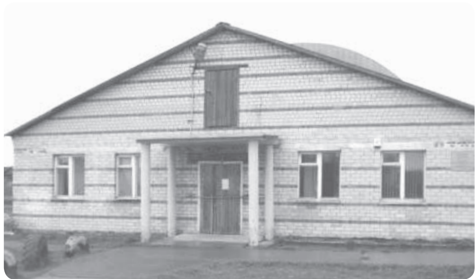
Спорткомплекс в посёлке Харута

Также посёлок имеет круглогодичное авиасообщение. Здесь расположена взлётно-посадочная полоса для самолетов Ан-2 и вертолётная площадка. Пассажирские перевозки по маршруту Харута – Нарьян-Мар выполняет