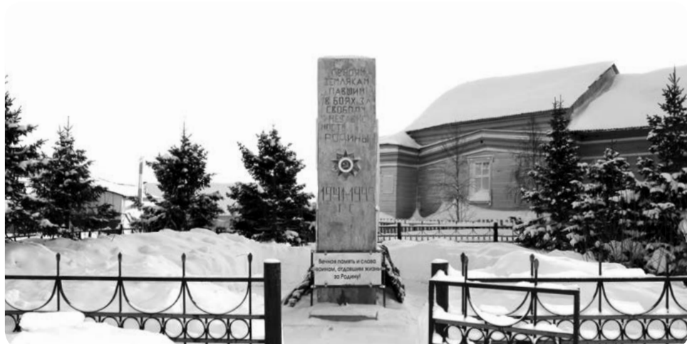
Обелиск землякам, погибшим в годы Великой Отечественной войны (с. Тельвиска)