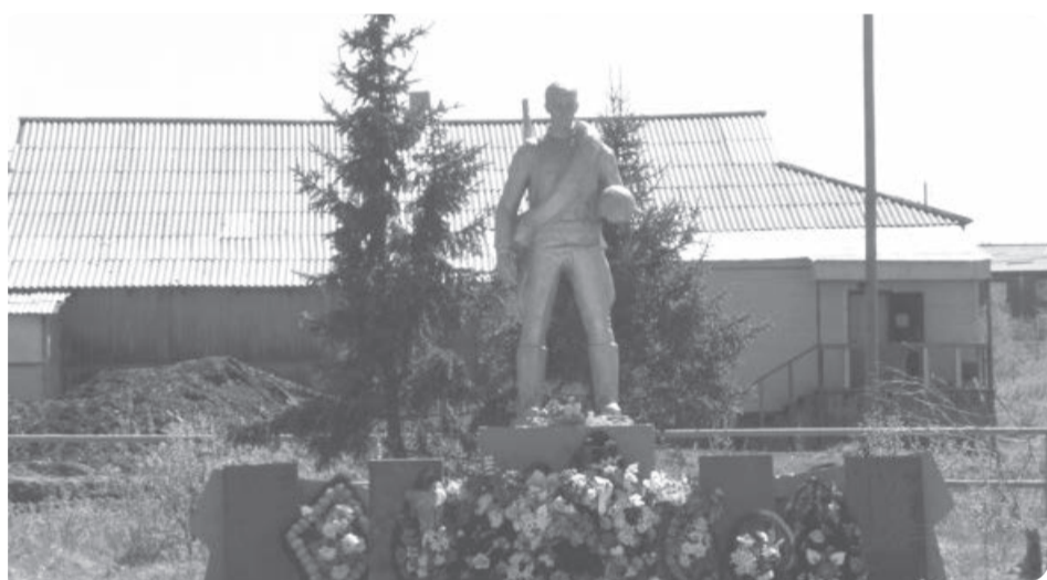
Памятник погибшим воинам-землякам

реки Харуты переводится с ненецкого языка как «Лиственничная река».