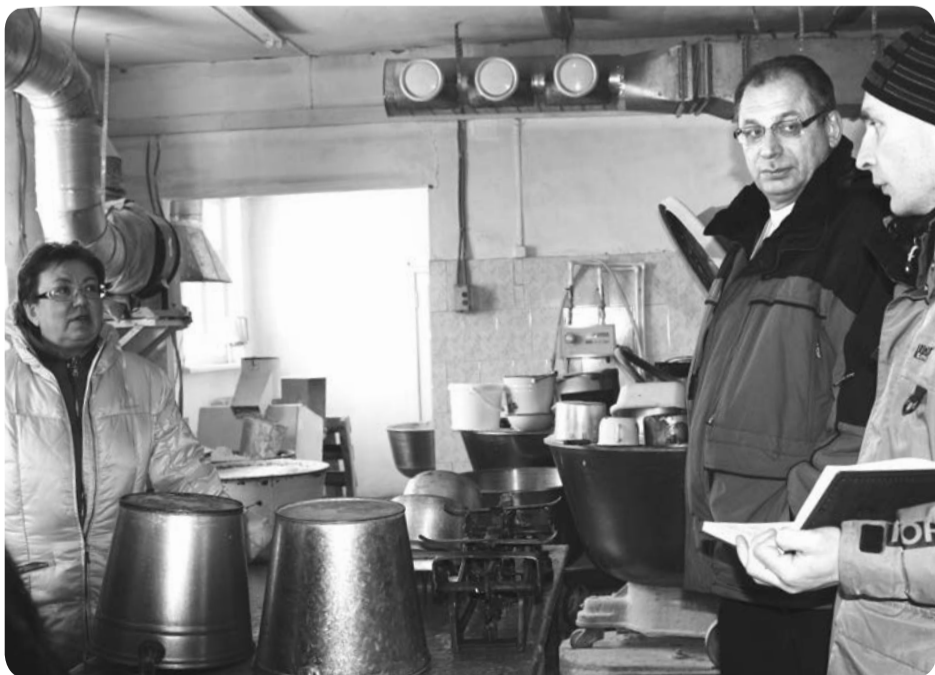
Пекарня в Хорей-Вере нуждается в капитальном ремонте

коллектив учреждения начинает подготовку к будущему переезду. Управление образования администрации Заполярного района совместно с руководством учреждения составляют перечень оборудования для нового просторного здания. Посетив самую главную стройку Харуты, глава Заполярного района поручил организовать выезд на объект специалистов МКУ ЗР «Северное» для проведения строительного контроля: