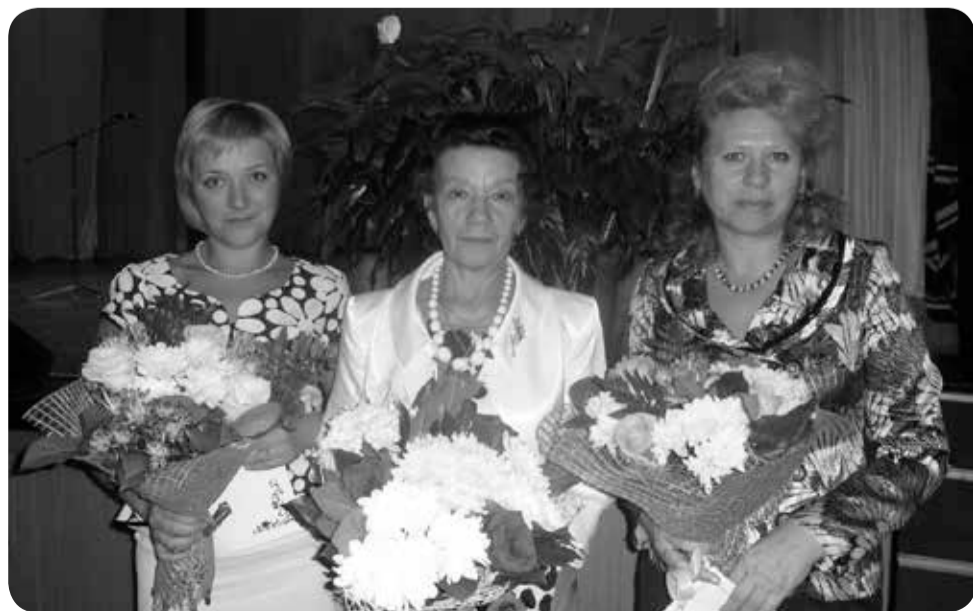
Почётные учителя школы п. Искателей