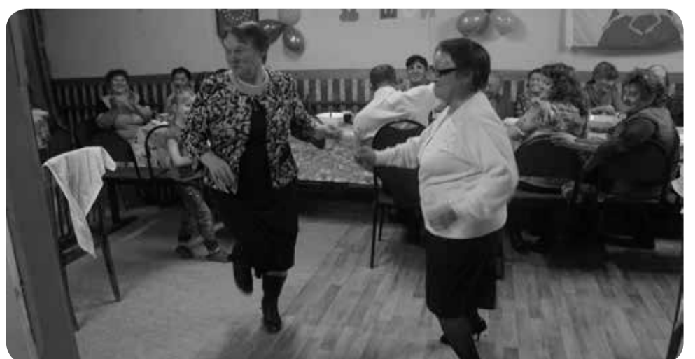
Танцы в Хорей-Верее