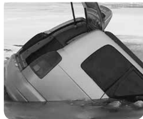
Выезжать на лёд опасно

МЧС предупреждает: Не выходите и, тем более не выезжайте на неокрепший лёд, это опасно для жизни!