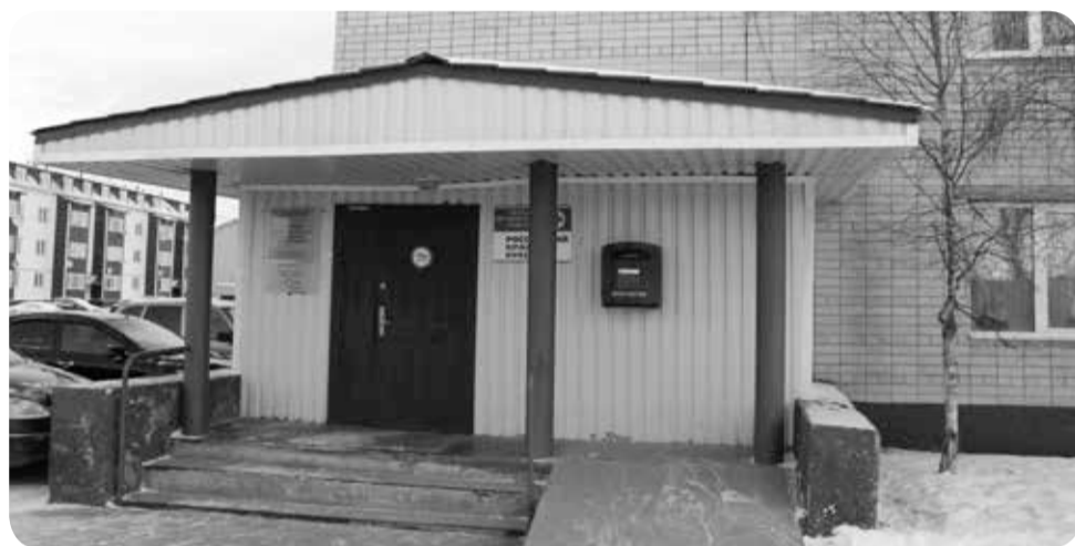
Комплексный центр социального обслуживания

вают, как правильно справляться со сложностями, противостоять недугам, отстаивать свои права и чувствовать себя защищённым.