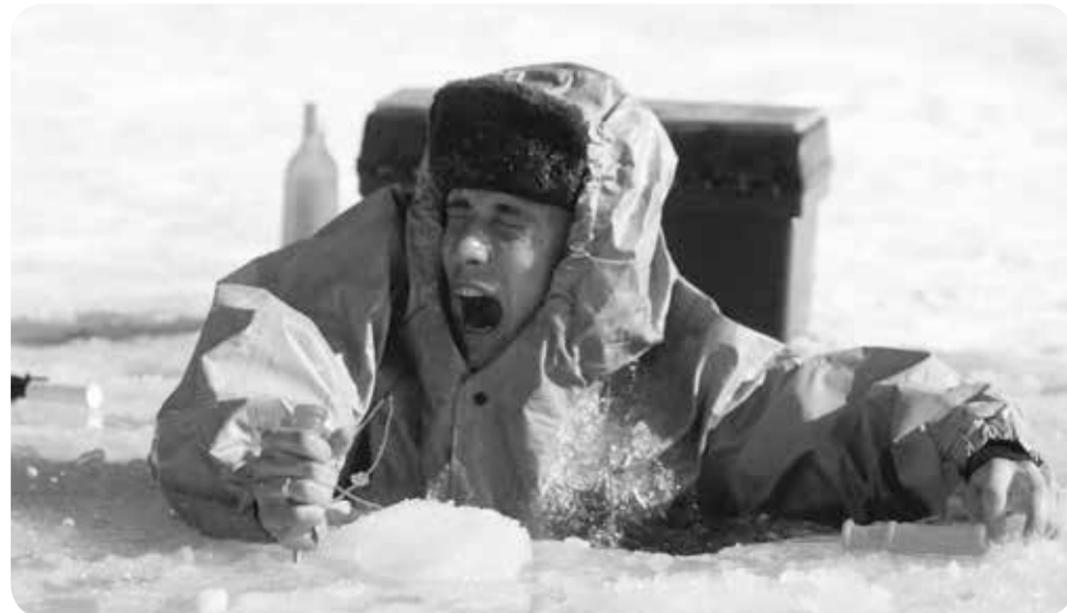
Главное не поддаваться панике

при температуре воды 5-15°C – от 3,5 до 4,5 часов;