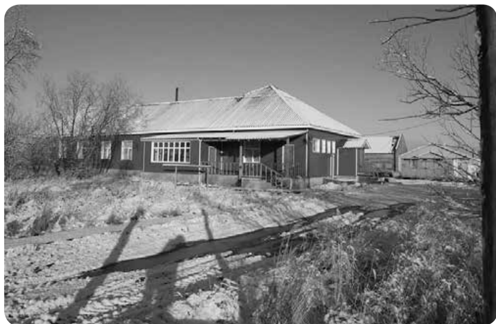
Библиотека села Несь