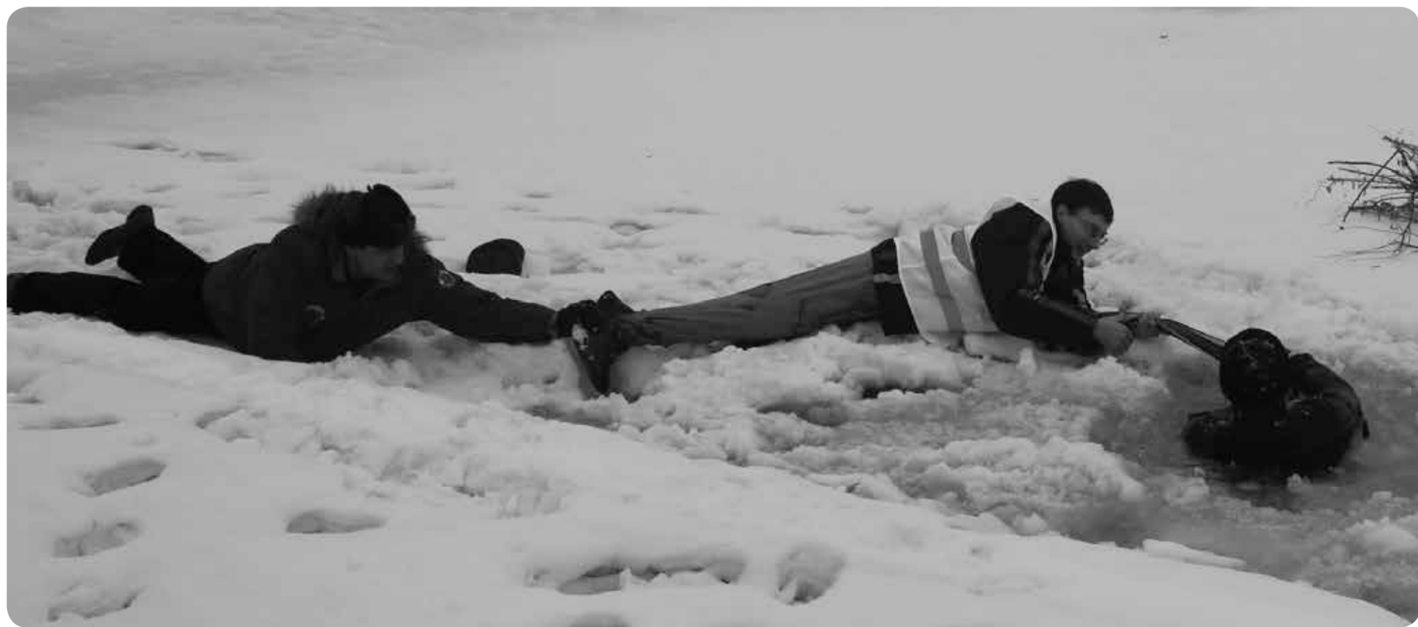
Основное условие безопасности – в соответствии толщины льда прилагаемой нагрузке