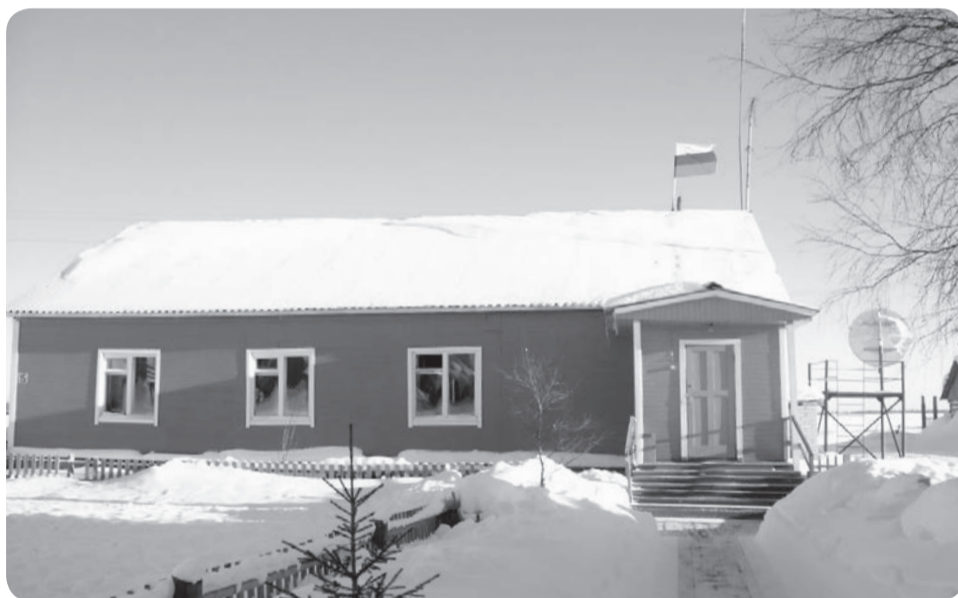
Здание администрации МО «Коткинский сельсовет»

навигации (две недели в мае или июне) из города Печоры, а также гусеничным транспортом зимой из Нарьян-Мара.