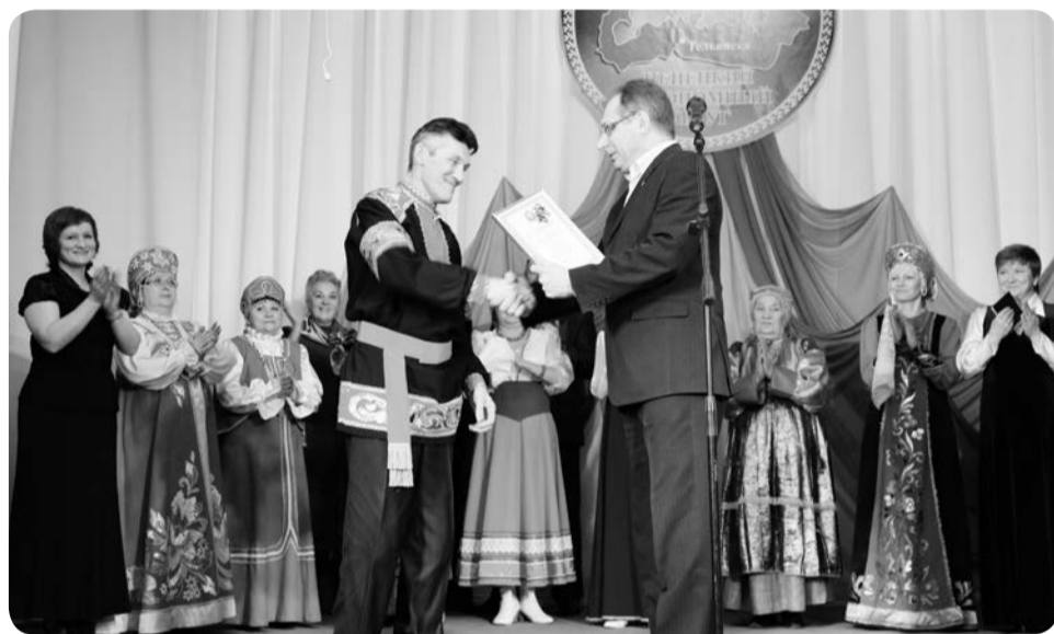
Глава Заполярного района поздравляет участников фестиваля