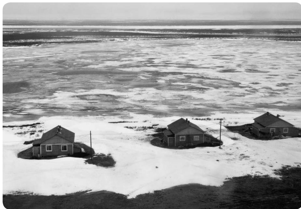
Вид на Каратайку с высоты птичьего полёта

СПРАВКА. Указ об учреждении нового праздника — Дня местного самоуправления — президент России Владимир Путин подписал 10 июня 2012 года. Эта дата выбрана неслучайно, 21 апреля — день издания в 1785 году Жалованной грамоты городам, подписанной Екатериной II. «Грамота» положила начало развитию российского законодательства о местном самоуправлении