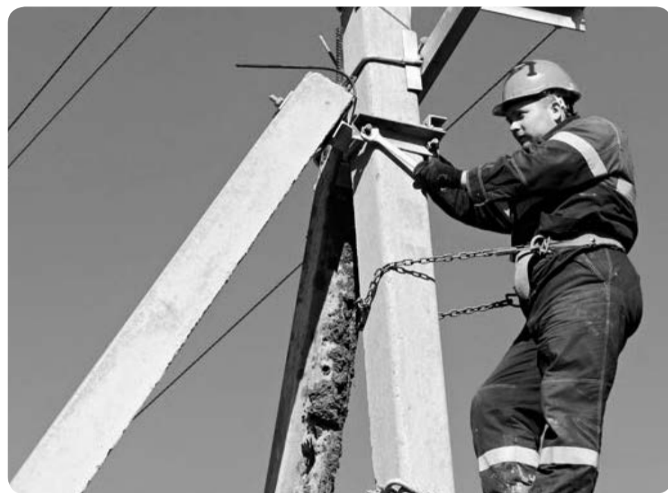
Монтаж линии электропередачи

Реализация мероприятий по реконструкции линий электропередачи позволяет улучшить качество передаваемой потребителям электрической энергии, уменьшить потери электротока в сетях, сократить затраты на обслуживание и ремонт сетей, а тем самым сократить энергозатраты и увеличить экономии бюджетных средств Заполярного района.