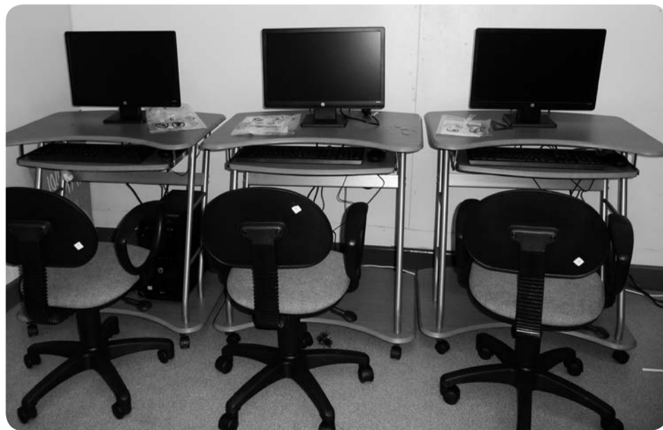
Оборудование для компьютерного класса

– Приобретение нового оборудования способствует как умственному, так и физическому развитию наших детей. Помощь от нефтяных компаний даёт им возможность не отставать, а где-то и опережать сверстников из других регионов, – пояснили в Управлении образования администрации Заполярного района.