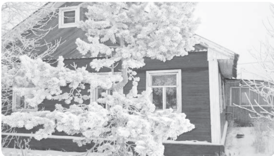
Коткино называют одним из красивейших посёлков Заполярного района