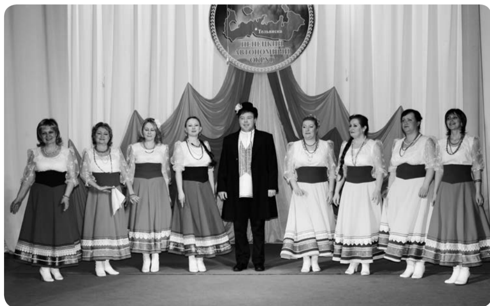
Народный ансамбль «Сударушка»

Вдохновение от причастности к этому чудесному празднику, наслаждение волшебством душевной песни объединяло в этот день исполнителей из разных поселений. Во время антракта они дружески общались между собой за чашкой чая. Из этих разговоров легко можно было понять: здесь собрались родственные души, которые объединяет твёрдая вера в то, что культура в поселениях живёт и развивается, а все проблемы и неурядицы так легко пережить, если в сердце горит неугасимым огнём желание творить на радость людям!