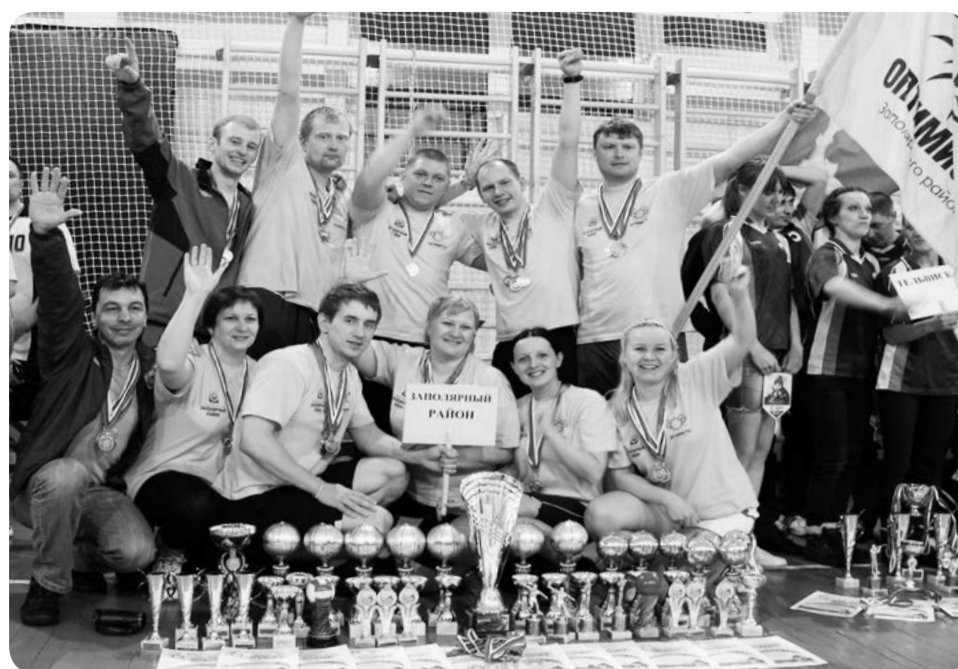
Команда Заполярного района завоевала кубок VI Межмуниципальной спартакиады в Коткино