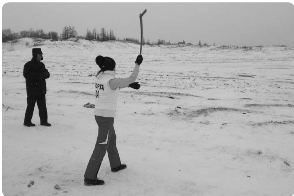
Метание топора на дальность

Прогнозы на эти соревнования тренеры делать не спешат. По младшим и средним возрастным группам победы в многоборье за последнее время были, а вот у старших ребят были лучшие результаты в отдельных видах, но в целом по многоборью побед и призовых мест не было уже несколько лет.