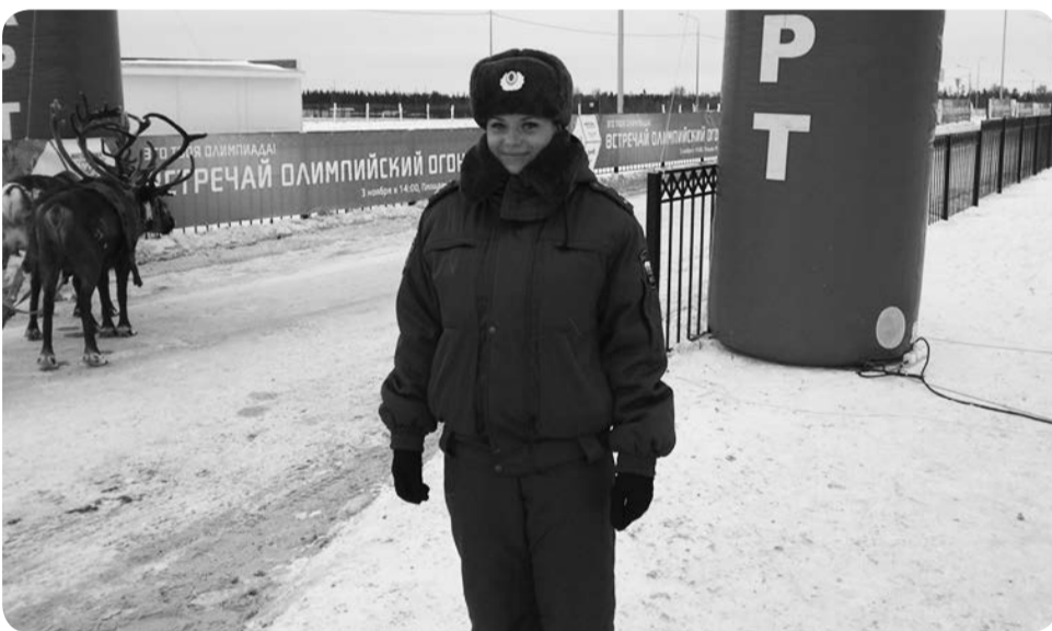
Наша служба интересна и важна