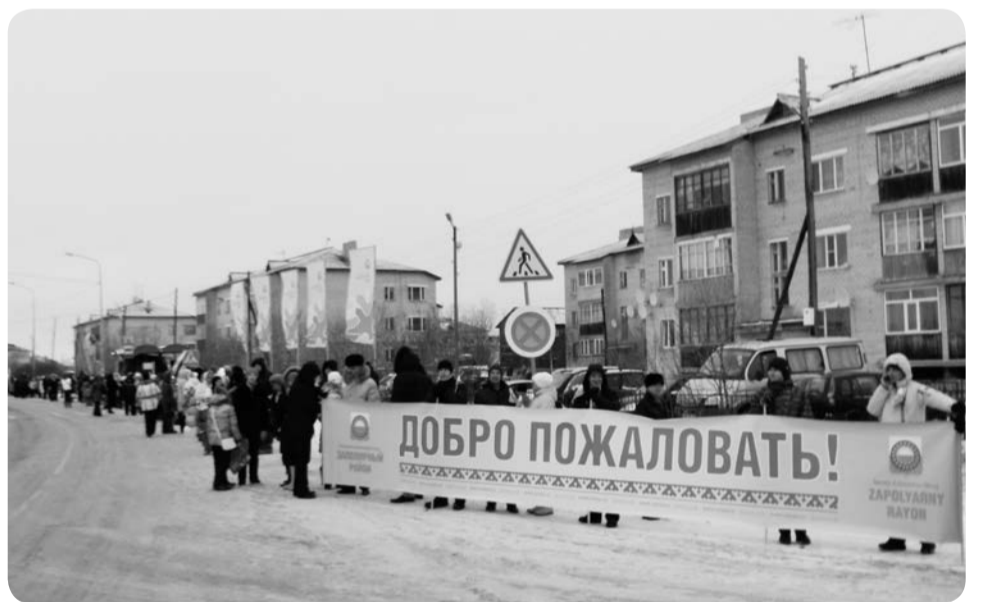
Жители Заполярного района в ожидании главного символа Олимпиады

до начала эстафеты. Не за то, как побежит, а за то, как доберётся в город из Тельвиски, где сейчас живёт и работает. Переживала, встанет ли река. Но 3 ноября она была в Нарьян-Маре и вместе с другими участниками эстафеты создавала историю. После забега призналась, таких эмоций не испытывала, пожалуй, с московской Олимпиады. Чувства очень схожие – гордость и восхищение. Свои олимпийские двести метров про-