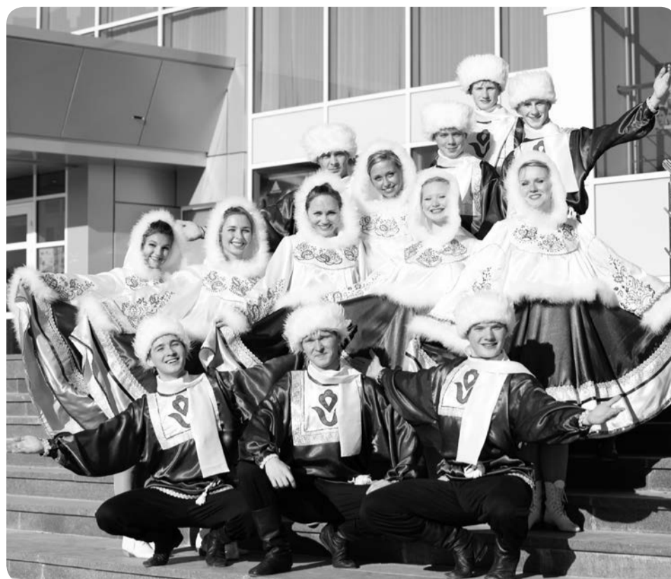
Народный ансамбль танца «Юность Севера»

А в зале Этнокультурного центра свой праздничный вечер провело творческое объединение «Заполярье». Писатели и исполнители округа под аккомпанемент гитары пели песни и читали стихи.